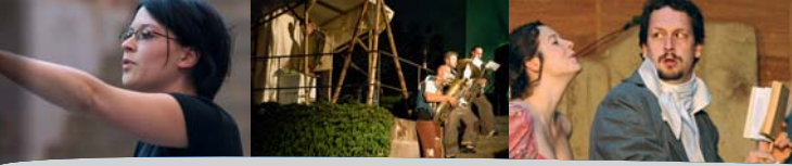
Rampenschau 2005-2010 Städtisches Museum Göttingen, Offene Kirche St. Klara, Museum Tucherschloss mit Hirsvogelsaal, Ostfriesische Landschaft, Theater im OP, Museum Tucherschloss